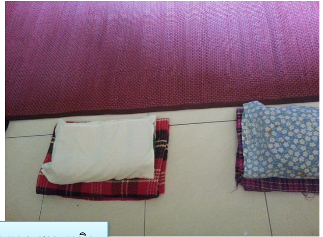
ชั้น 1 สถานที่พักนอนแยก ชาย หญิง