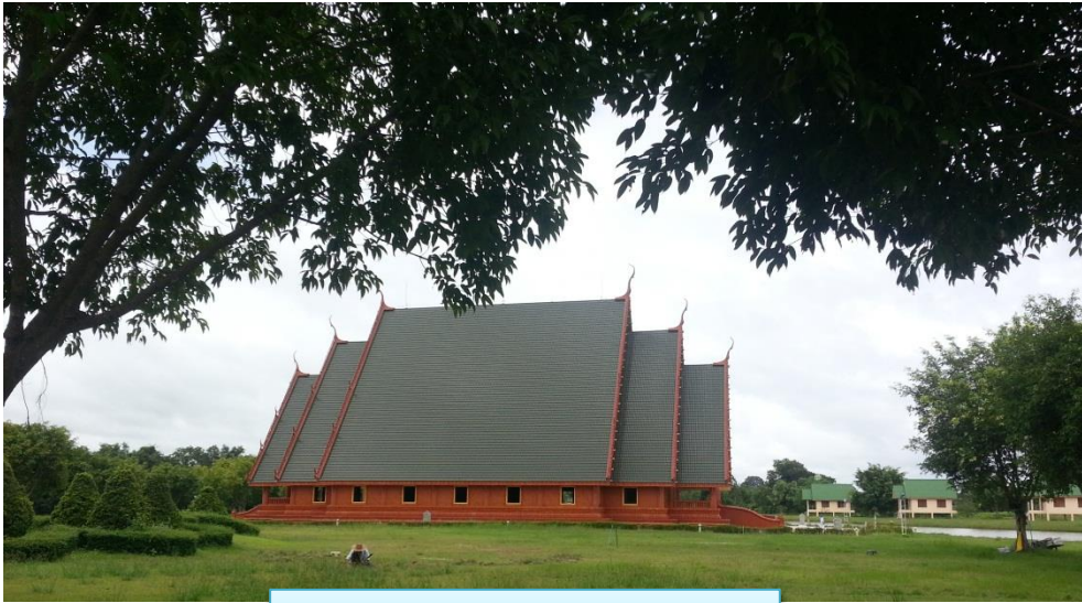
ศาลาธรรมหลังที่ 1