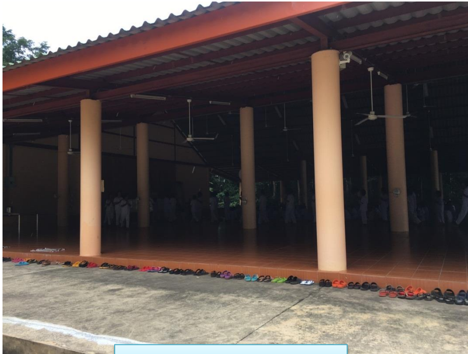
ศาลาโรงทาน