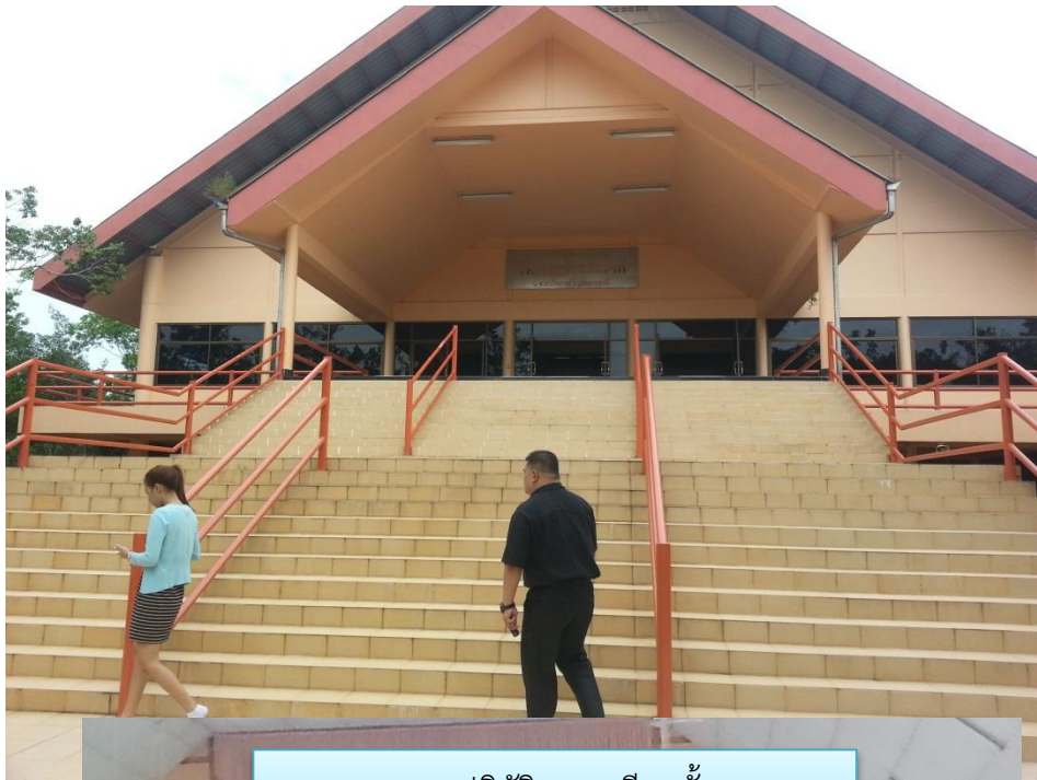
ศาลาปฏิบัติธรรม มี ๒ ชั้น